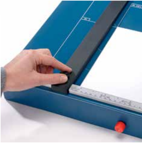
Verstelbare metalen achteraanslag met schroefbevestiging voor snelle formaatbepaling - op beide hoekaanslagen inzetbaar