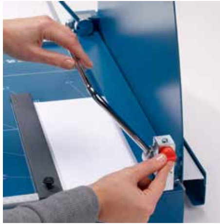
Vergrendelbare beugelaandruk zorgt voor een optimale fixatie van het snijgoed