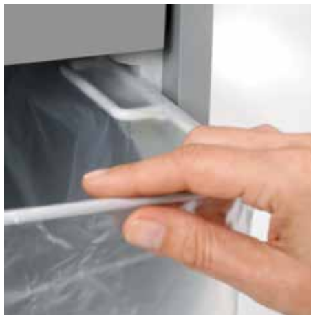
Uittrekbare, afgeronde rail maakt eenvoudig verwisselen van de opvangzak mogelijk