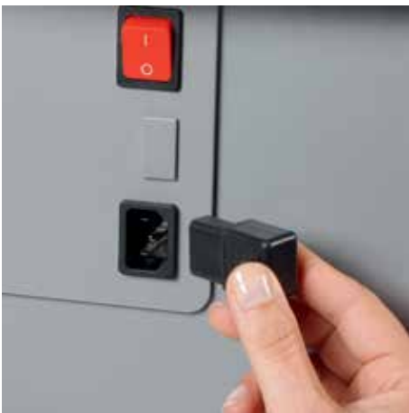
Uittrekbare connectorstekker vereenvoudigt het snel verplaatsen van de papiervernietiger van A naar B