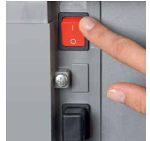
Afzonderlijke hoofdschakelaar bevindt zich aan de achterkant van de papiervernietiger en scheidt het apparaat volledig van het stroomnet