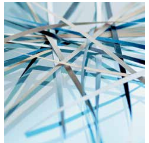
Veiligheidsniveau P-2: aanbevolen voor gegevensdragers met interne gegevens die onleesbaar moeten worden gemaakt