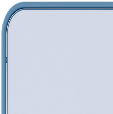
Emaille - Blauw Voet + bordframe RAL 5024