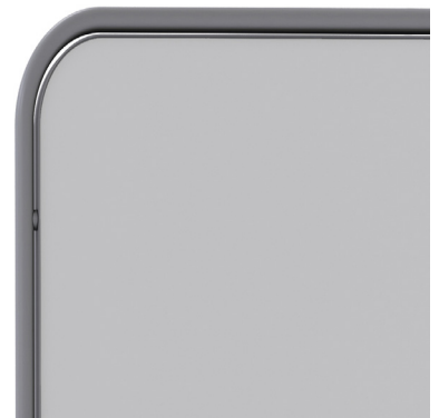
Emaille - Grijs Voet + bordframe RAL 7037