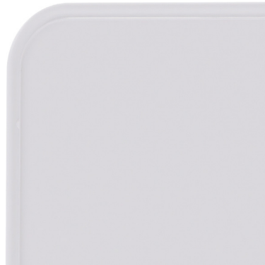
Emaille - Wit Voet + bordframe RAL 9016