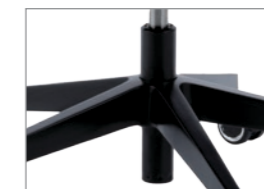
Onderhoudsvrij veiligheids gasveer DIN EN 16955 – basis: zwart