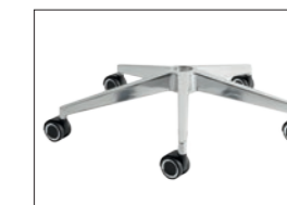
Optioneel: Aluminium gepolijst of zwarte poeder coating