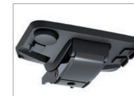
ERGO synchroon mechaniek PLUS