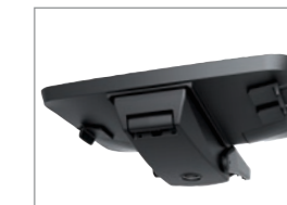
AUTO synchroon mechaniek